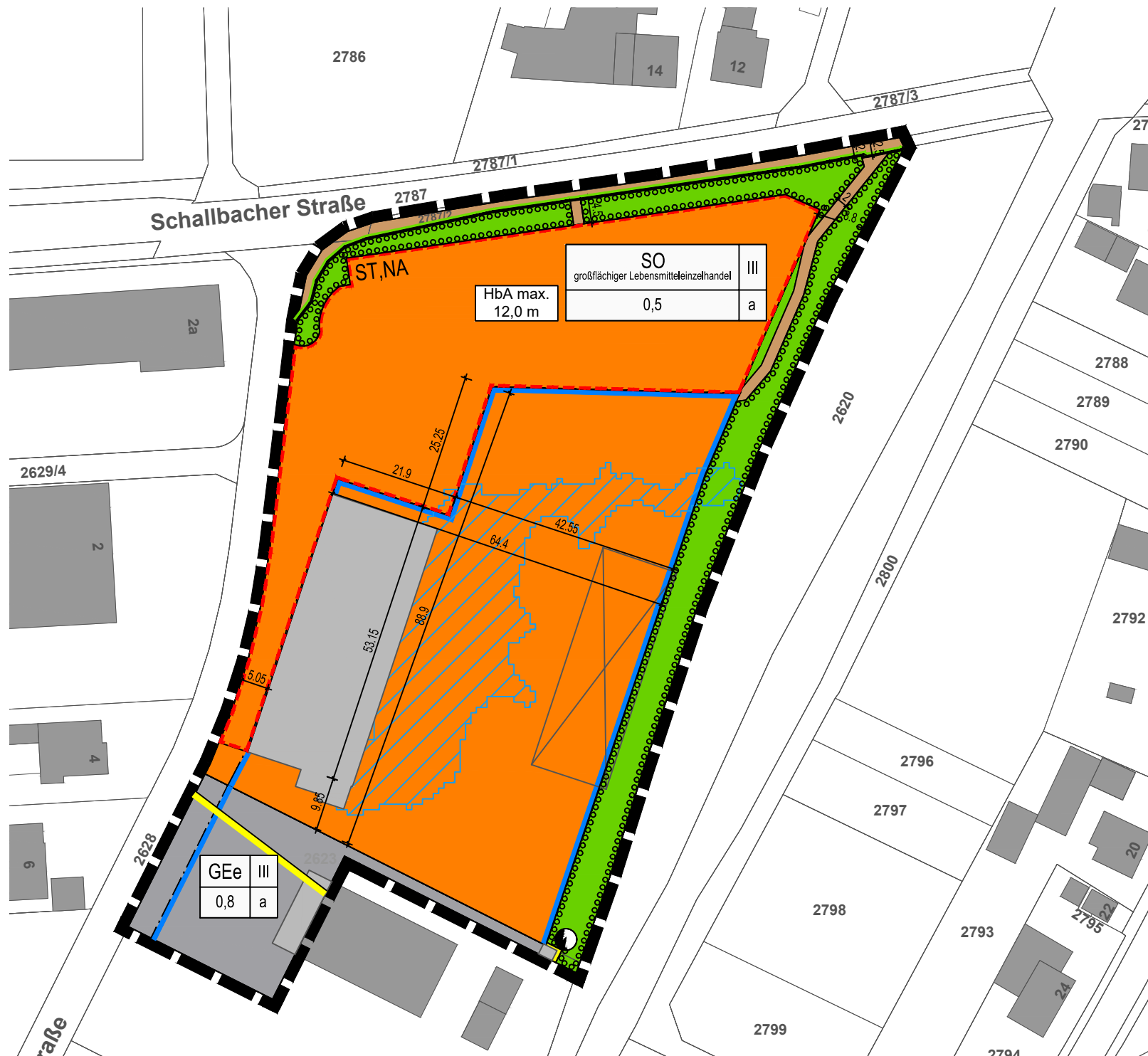
3. Bebauungsplanänderung "Neumatten - In der Au", Deckblatt im Originalformat, M 1:1000